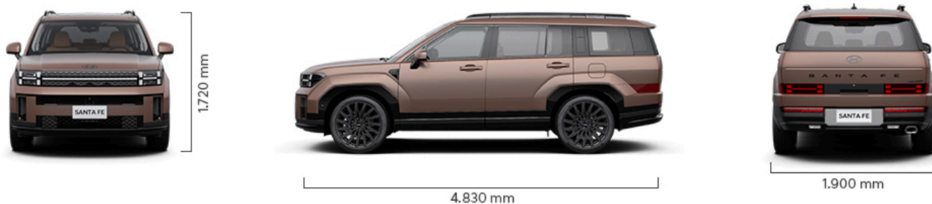
Abbildung ist als unverbindlich zu betrachten. Fahrzeugabbildungen enthalten z. T. aufpreispflichtige Sonderausstattungen.