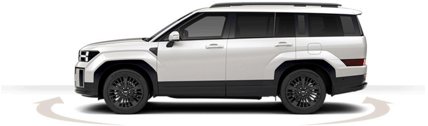
Abbildung ist als unverbindlich zu betrachten. Fahrzeugabbildungen enthalten z. T. aufpreispflichtige Sonderausstattungen.