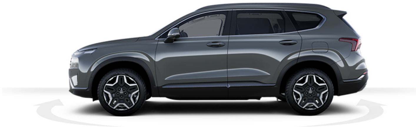
Abbildung ist als unverbindlich zu betrachten. Fahrzeugabbildungen enthalten z. T. aufpreispflichtige Sonderausstattungen.