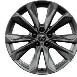
20-Zoll-Leichtmetallräder im F SPORT-Design mit Bereifung 245/45RF20 vorne und 275/40RF20 hinten