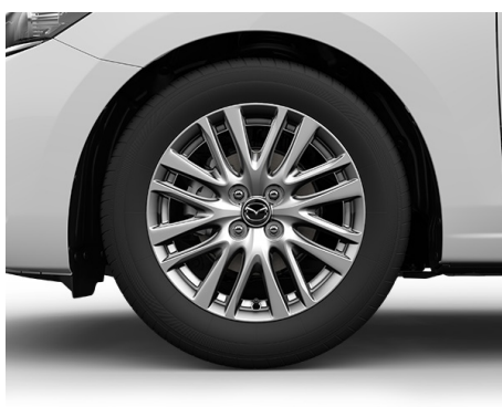
16-ZOLL-LEICHTMETALLFELGEN MIT 185/60 R16 BEREIFUNG