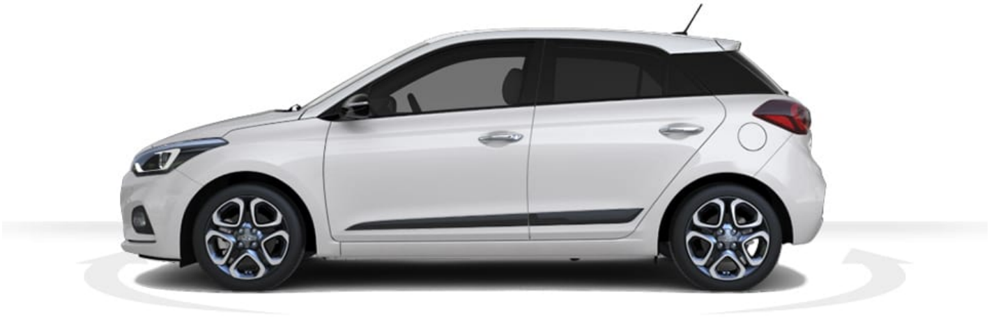
Abbildung ist als unverbindlich zu betrachten und stellt eine annähernde Beschreibung dar. Fahrzeugabbildungen enthalten z. T. aufpreispflichtige Sonderausstattungen.